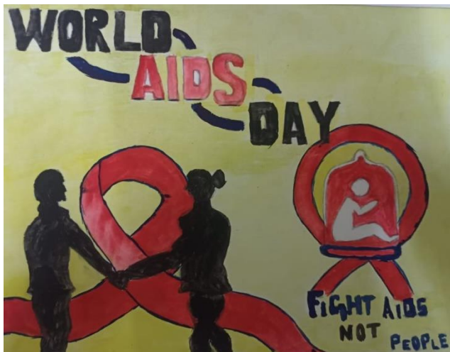
Blood donation and AIDS awerness poster created by students